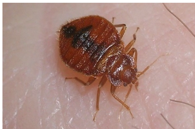
ساس بالغ پس از مکیدن خون.