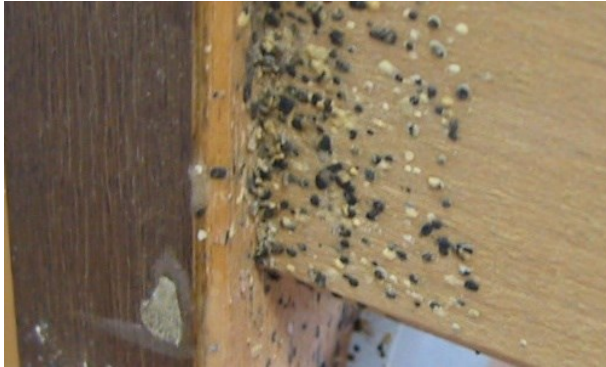
آلودگی شدید قاب تخت با مدفوع ساس.