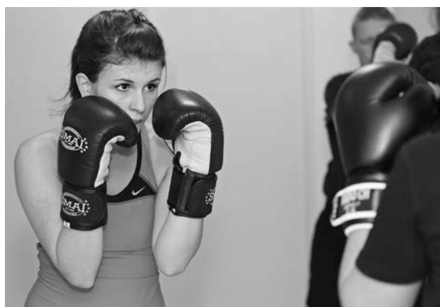
Rund 13 000 Kinder und Jugendliche trainierten regelmässig im Sportverein.

Die freiwilligen Sportangebote für Kinder und Jugendliche in über sechzig Sportarten erfreuten sich grosser Nachfrage. Die Semesterkurse wurden von 1503 Teilnehmenden besucht, in den Feriensportkursen waren total 4280 Teilnehmende aktiv.