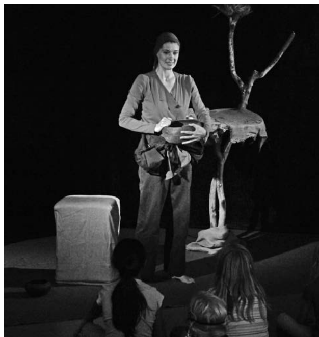
Das Theater «Kleine Welten» lockte grosse und kleine Gäste ins NONAM.

Indianische Konzerte, das Theater «Kleine Welten» und Ferienangebote lockten grosse und kleine Gäste ins NONAM. An der «Langen Nacht der Zürcher Museen» begeisterte