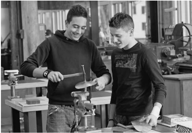
Das Berufsvorbereitungsjahr verhilft vielen jungen Menschen zu einer beruflichen Anschlusslösung.

Die verschiedenen Angebote des Berufsvorbereitungsjahres weisen unterschiedliche Schwerpunkte auf. Im Zentrum stehen die Berufswahl, die berufliche Praxis sowie die verschiedenen Möglichkeiten, bereits im 10. Schuljahr betriebliche Praxiserfahrung zu sammeln. Im Berichtsjahr wurden neun Klassen geführt, in denen die Schülerinnen und Schüler in internen (Bistro) und externen (Heime, Pflegebetriebe, Spitäler, Betreuungseinrichtungen, Detailhandel) Praktikumsplätzen tätig sind und wichtige Erfahrungen sammeln. Daneben besuchen sie intern die Schule während meist zwei Tagen pro Woche.