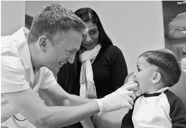
Zweijähriges Kind beim ersten Untersuchen in der Schulzahnklinik.

Krankenkassenverband und dem Preisüberwacher. Dank sehr grossen Anstrengungen aller Mitarbeiterinnen und Mitarbeiter kann der SZD trotzdem auf ein finanziell erfolgreiches Jahr zurückblicken – dies, obwohl in der grössten Klinik (Zürich Nord) aufgrund der Umbautätigkeit im Gebäude nur ein reduzierter Betrieb möglich war. Die Patientenzahlen im Einzugsgebiet dieser Klinik nahmen weiter zu, was auch in Zukunft eine grosse Herausforderung darstellen wird. Ohne Anpassung der Kapazität wird die Klinik dem Ansturm der Patientinnen und Patienten nicht gewachsen sein.