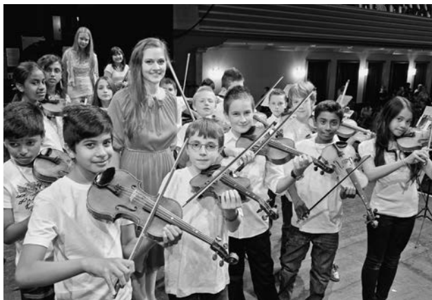
Höhepunkt des Klassenmusizierens: das grosse Konzert mit Heidi Happy.

Die Instrumente, die die Kinder von MKZ gratis zur Verfügung gestellt erhalten, werden zu einem grossen Teil durch Drittmittel finanziert. Auch für 2013 darf wieder mit namhaften Sponsoren- und Gönnerbeiträgen gerechnet werden, u. a. auch von der Förderstiftung MKZ. Um das Klassenmusizieren breiteren Kreisen bekannt zu machen und den musizierenden Kindern und ihren Familien ein unvergessliches Konzerterlebnis zu vermitteln, veranstaltete MKZ Ende Mai im Volkshaus das zweite Benefizkonzert mit 200 musizierenden Kindern. Star-gast war die Sängerin und Komponistin Heidi Happy, die eigens für diesen Anlass drei neue Songs geschrieben beziehungsweise arrangiert hatte und mit den Kindern zur Uraufführung brachte.