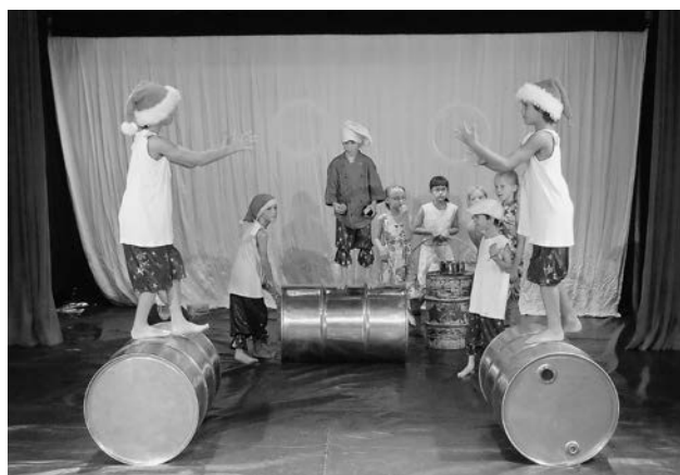
Sommerferienkurs mit dem Circolino Pippistrello.

Das Jahr 2012 stand ganz im Zeichen des Projekts «Neupositionierung der Schulkultur». Der Auftrag des Stadtrats, den Bereich Schulkultur einer strategischen Analyse zu unterziehen, wurde in verschiedenen Schritten ausgeführt. Die Strategie der neuen Fachstelle Schulkultur baut auf dem Fundament eines Leitbildes und auf den drei Säulen Kooperationen, Angebote und Dienstleistungen auf. Angebote mit partizipativen Ansätzen sollen gegenüber rezeptiven Angeboten in der Mehrzahl sein. Der Prozess der Neupositionierung der Schulkultur ist noch nicht abgeschlossen.