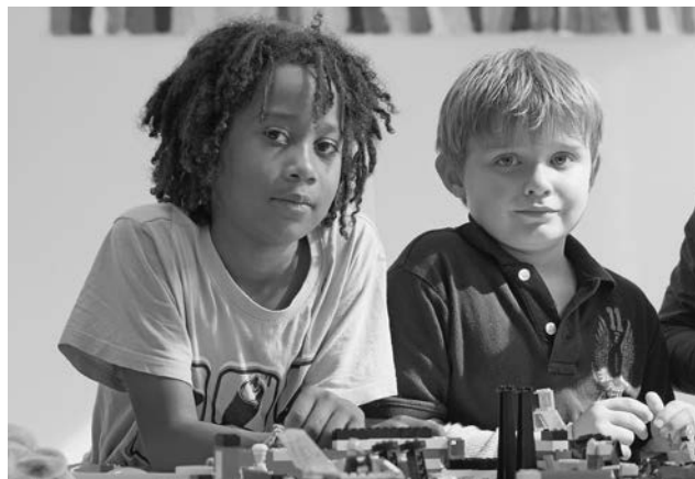
Freizeit in der Betreuungseinrichtung.

Die Geschäftsleitung tagte an elf Sitzungen und einer Retraite. Sie hat das MAB-Verfahren für Lehrpersonen vereinfacht, Qualitätsstandards in der Betreuung verabschiedet und das Geschäftsreglement reformiert, um eine effizientere Arbeit der Milizbehörde zu ermöglichen. Das KSP-Plenum führte gesamthaft drei Sitzungen durch. Drei Vakanzen der Schulbehörden konnten neu besetzt werden.