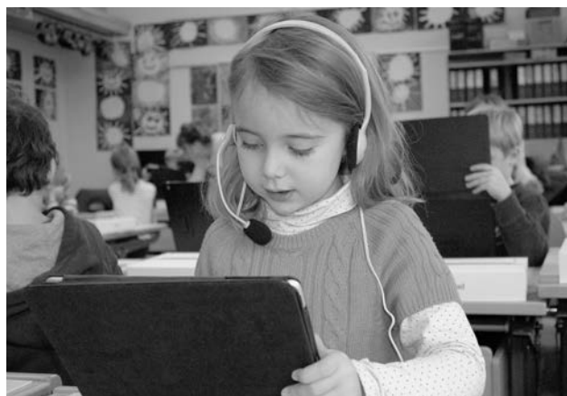
«Digitaler Rucksack»: Erste Erkundung des Tablets.

Im November 2012 startete in je zwei 1. und 4. Klassen der Stadtzürcher Volksschule das Pilotprojekt «Digitaler Rucksack». Alle Schülerinnen und Schüler erhielten ein persönliches Tablet. Nun wird geprüft, wie sich diese flexibel einsetzbaren Geräte in den Unterricht integrieren lassen. Die Kinder werden beim Lernen durch ausgewählte Apps unterstützt und erfahren, wie das Arbeitsgerät sinnvoll eingesetzt werden kann. Neben kreativem Arbeiten wird durch die intensive Bearbeitung von medienpädagogischen und medienbildnerischen Themen die Medienkompetenz der Schülerinnen und Schüler gefördert. Das Pilotprojekt wird im Rahmen des Legislaturschwerpunkts eZürich in Kooperation des Schulamts mit der OIZ ermöglicht und von Prof. Beat Döbeli, Dozent für Medienbildung und Informatikdidaktik an der PHZ Schwyz, wissenschaftlich begleitet.