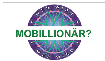
Wer wird Mobillionär?

An welcher VBZ-Haltestelle steigen am meisten Leute ein und aus? Wie weit geht eine Person täglich zu Fuss? Wissen ist Trumpf bei «Wer wird Mobillionär?». Die Schülerinnen und Schüler eignen sich ein Grundwissen zu verschiedenen Mobilitätsthemen der Stadt Zürich an. Das Gelernte können sie in einem Quiz unter Beweis stellen und so zu «Mobillionären» werden. In der vierstündigen Version des Moduls erstellen sie eigene Fragen und sind selber Quizmaster.