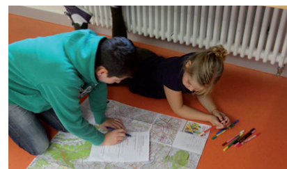
MAP Züri-Zeichner beim Routenplanen

Die MAP Züri-Zeichner lernen den Mobilitätsstadtplan «MAP Zürich» und den Umgang mit einer Stadtkarte kennen: welche Inhalte sind vorhanden, wie liest man eine Legende, wie nutzt man ein Strassenverzeichnis, was ist ein Koordinatensystem etc. Die Schülerinnen und Schüler stellen in Gruppen einen Quartiersspaziergang anhand ihrer Lieblingsorte zusammen und laufen diesen ab. Dazu nutzen sie den MAP Zürich.