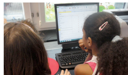
ZüriPlan-Talente lösen Aufgaben

Die ZüriPlan-Talente lernen mit Übungen den Umgang mit dem interaktiven Fuss- und Veloroutenplaner «ZüriPlan». Die Schülerinnen und Schüler planen einen ihnen bekannten Freizeitweg (zum Beispiel mit den öffentlichen Verkehrsmitteln ins Schwimmbad) mit dem Fuss- und Veloroutenplaner, vergleichen die Resultate mit ihren Erfahrungen und besprechen diese gemeinsam in der Klasse.