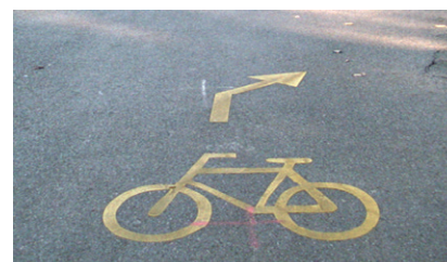
Velomarkierung auf Zürcher Strassen

Als Veloplaner erhalten die Schülerinnen und Schüler Einblick in die Aufgaben eines Verkehrsplaners. Welche Nutzergruppen sind auf unseren Strassen unterwegs, welche Ansprüche werden an den Strassenraum gestellt und wie sehen gute Lösungen aus? Die Kinder denken über eigene Lösungsvorschläge nach und lernen unter fachkundiger Führung einige Umsetzungen in der Praxis kennen.