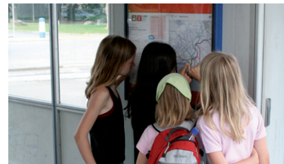
Beim Stadt-OL mit dem Tram unterwegs

Zu Fuss, mit dem Tram oder Bus versuchen die Kinder möglichst schnell die vorgegebenen Posten in der Stadt zu finden und die Fragen zu beantworten. Die Kinder lernen das Liniennetz der öffentlichen Verkehrsmittel kennen. Sie nutzen es selbständig und überlegen, mit welcher Fortbewegungsart sie am schnellsten zum Ziel kommen. Die gewählten Routen werden verglichen und die Erfahrungen ausgetauscht.